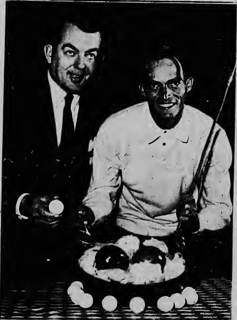
NEW YORK, E golfista Chi Chi Rodriguez a mescla salada cu dos bala di golf, mientras e vicepresidente di Eastern Airlines, M. Willison ta observa, despues cu el a ser nombra "Golf Pro for Eastern".

E aña durante cual mas awaserru a cai for di despues di 1915 ta aña 1933 cu 1175 mm.